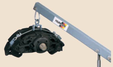
Hebezeug für Lkw-Bremssattel.