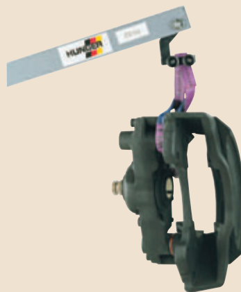
Universeller Spanngurt für Lkw-Bremssattel und Lkw-Bremsscheibe mit Nabe.

Am Tragarm des Bremsenlifts BL 2 wird das passende Hebezubehör befestigt.